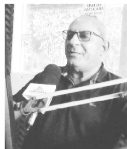
Nos Studios da Rádio Itabira